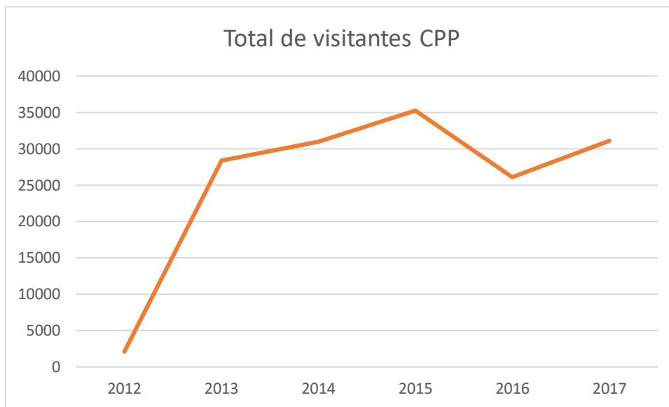
Gráfico 2 - Nº de visitantes recebidos no Radar Meteorológica por ano, desde a sua abertura